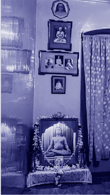
La stanza in soffitta al numero 4 di Gurpar Road, dove Mukunda si nascondeva spesso... per meditare!

Come leggiamo nell' Autobiografia di uno yogi , i santi indiani lo chiamavano choto Mahasaya , che egli tradusse umilmente come “piccolo signore”, ma che in realtà significa “piccola persona dalla grande anima”. Mahasaya è un termine che denota profondo rispetto. Quei santi sapevano che Mukunda, pur essendo ancora giovane, era egli stesso santo.