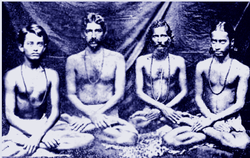
Fin dalla giovane età, Mukunda (a destra) meditava per lunghe ore di fila.

Già da bambino ebbe straordinarie esperienze interiori, a dimostrazione del fatto che era un'anima estremamente elevata.